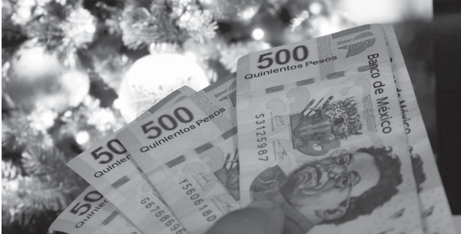
Los especialistas reconocieron que en el país hace falta una cultura que fomente una planeación financiera.