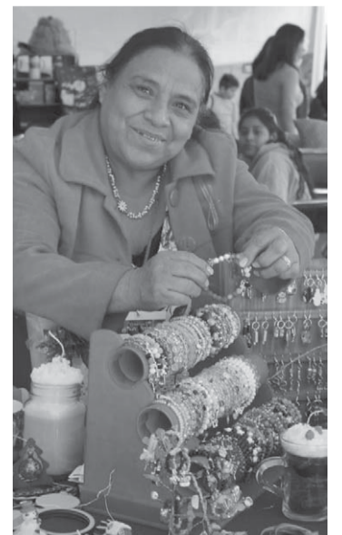
Venta de temporada.

Las poblanas exhiben creaciones únicas para fomentar y fortalecer su autonomía económica durante esta temporada decembrina